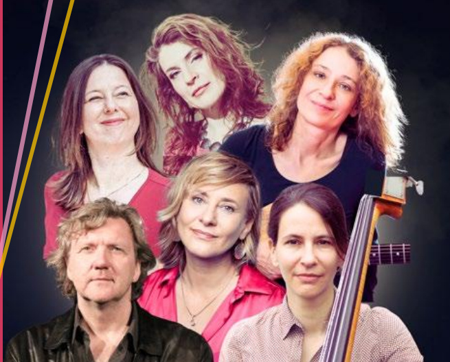
Collage © Britta Rex